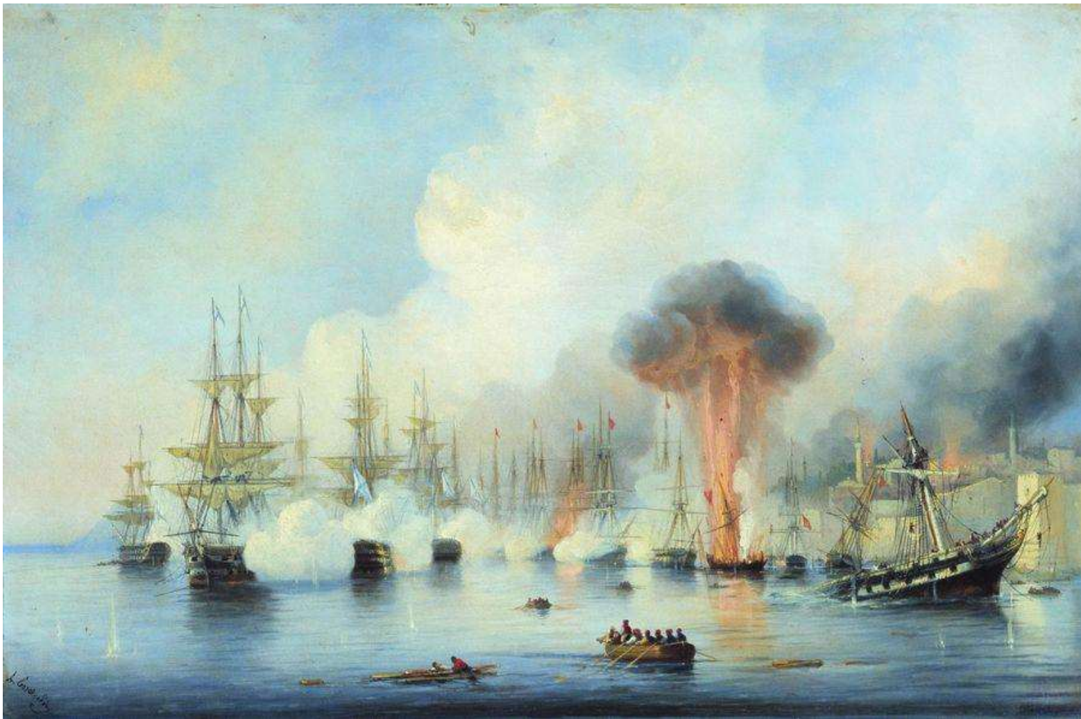
А. П. Боголюбов. «Синопский бой 18 ноября 1853 года».

В этом сражении турки потеряли 15 из 16 кораблей и свыше 3 тысяч человек убитыми и ранеными. В плен было взято около 200 человек, в том числе сам Осман-Паша и командиры трех кораблей.