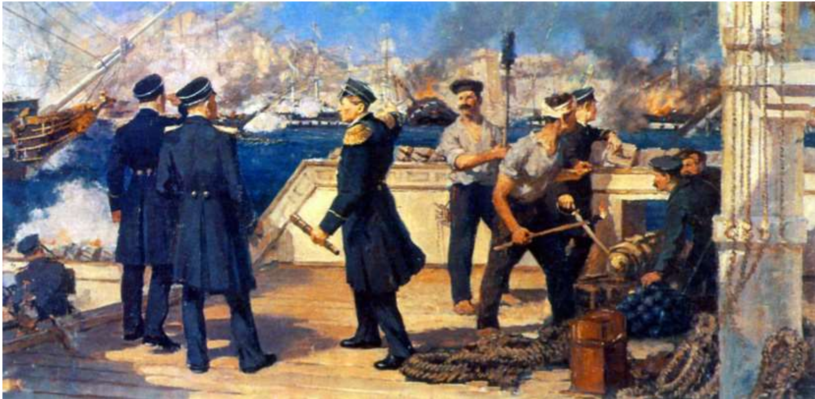
Н.П. Медовиков. «П.С. Нахимов во время Синопского сражения 18 ноября 1853 года».

В Синопском сражении ярко проявился флотоводческий талант выдающегося русского флотоводца Павла Степановича Нахимова.