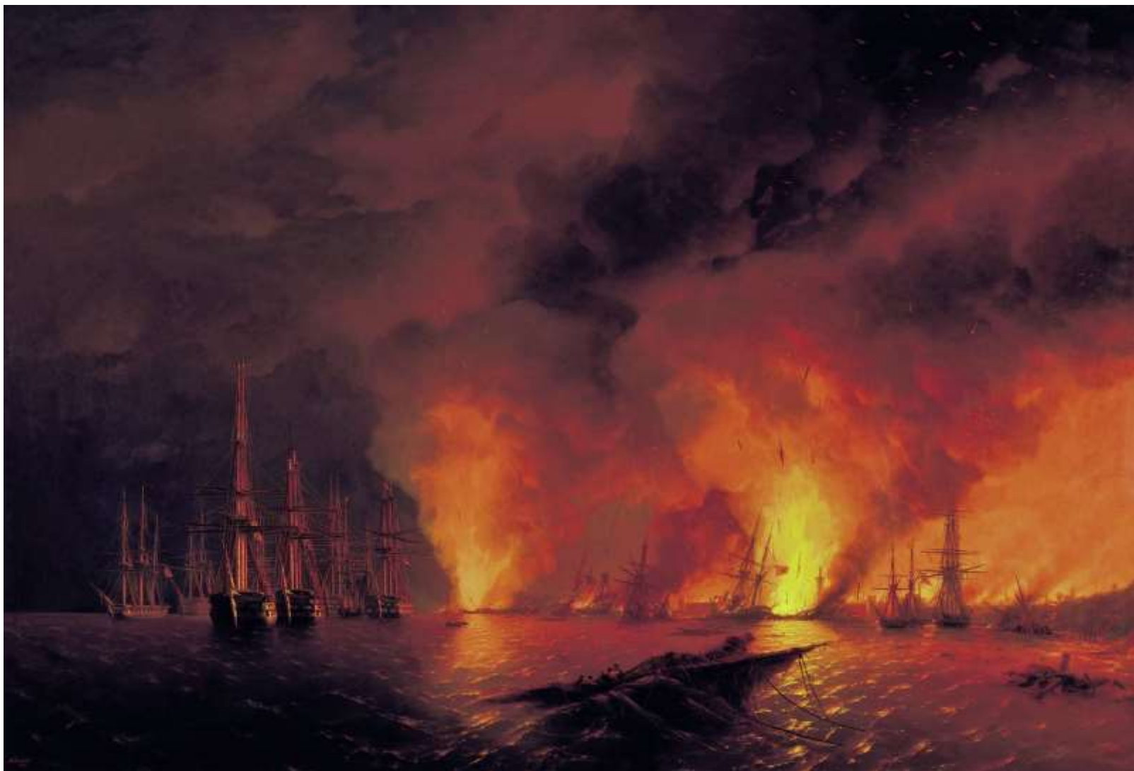
И. К. Айвазовский. «Синоп. Ночь после боя 18 ноября 1853 года».

Разгром турецкой эскадры в Синопском сражении значительно ослабил морские силы Турции и сорвал ее планы по высадке своих войск на побережье Кавказа.