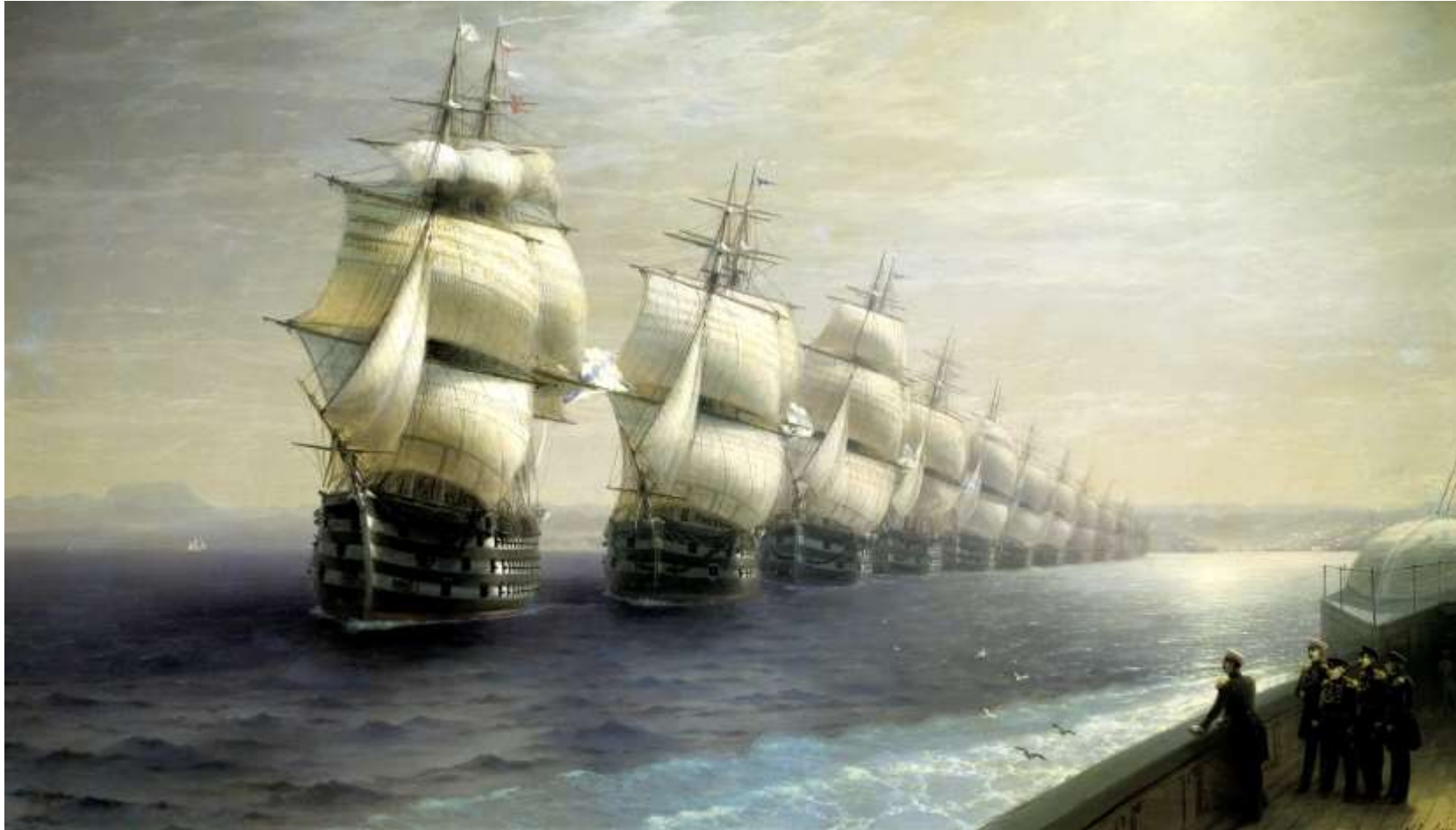
И. К. Айвазовский. «Смотр Черноморского флота в 1849 году».

Синопское морское сражение стало последним в истории крупным сражением эпохи парусного флота. На смену парусникам стали приходиться корабли с паровыми двигателями.