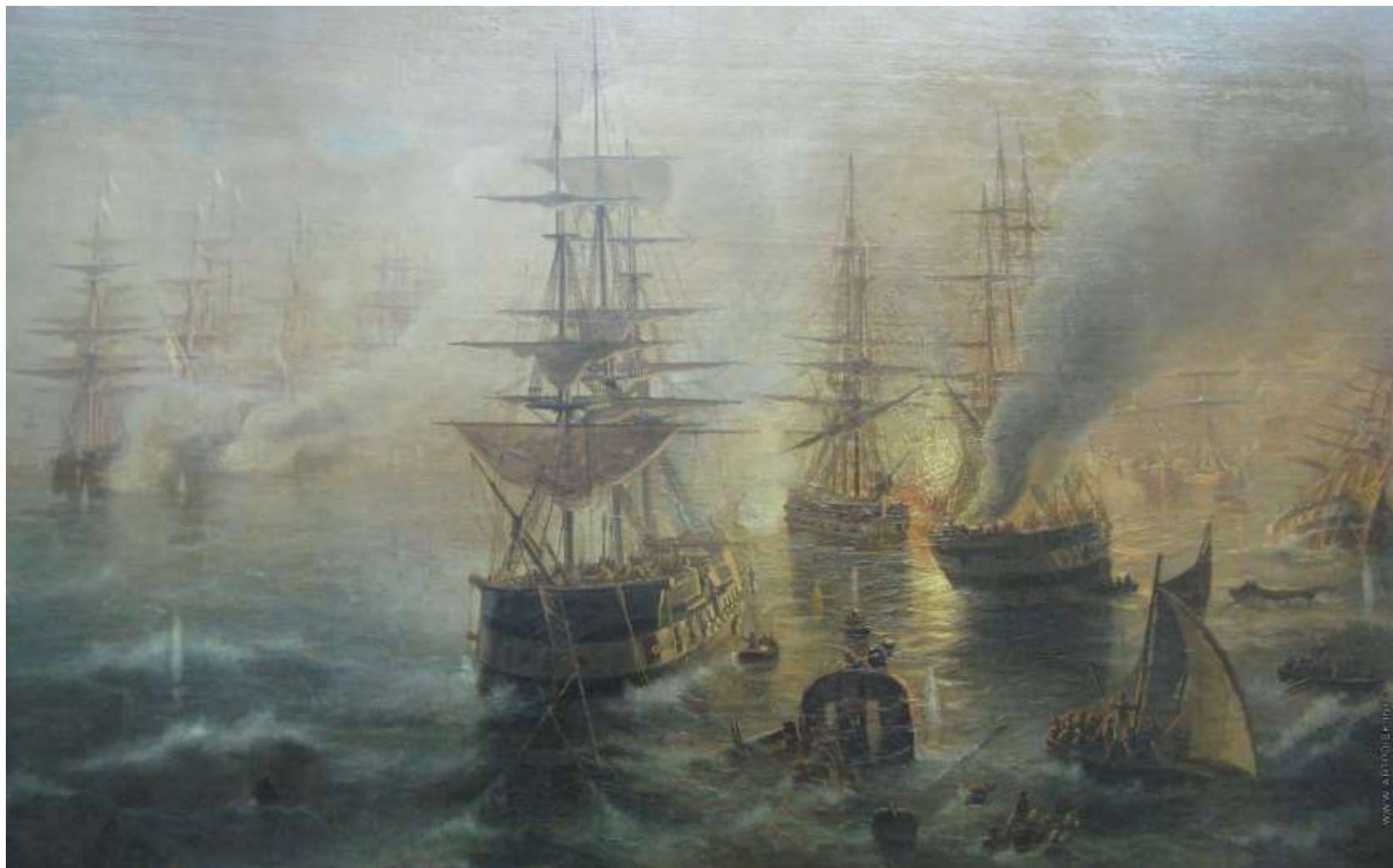
Жуковский Р. К. «Синопский бой в 1853 году».

Синопское морское сражение началось 18(30) ноября 1853 года в 12 часов 30 минут и продолжалось до 17 часов.